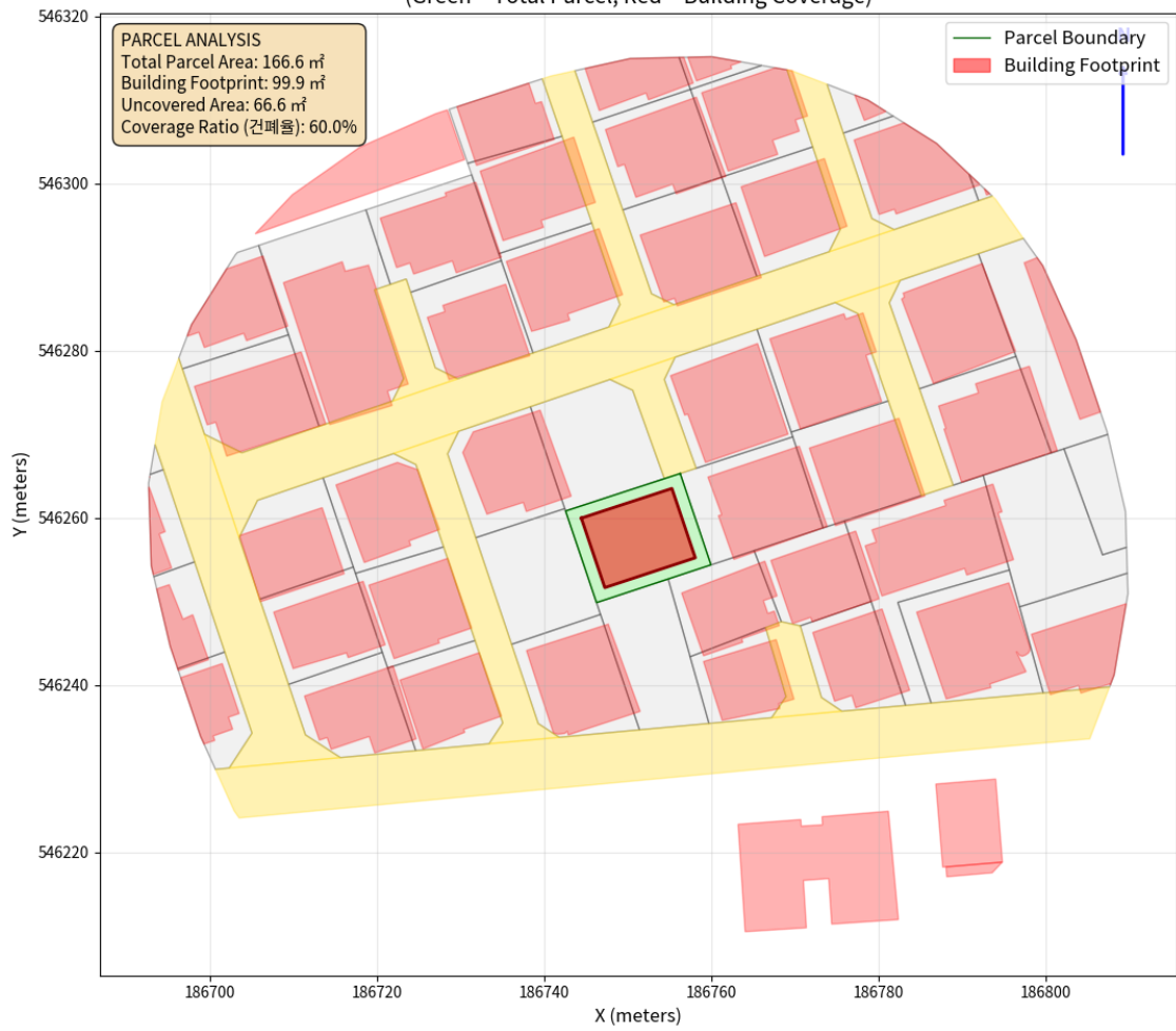
대지 배치도 (원본)