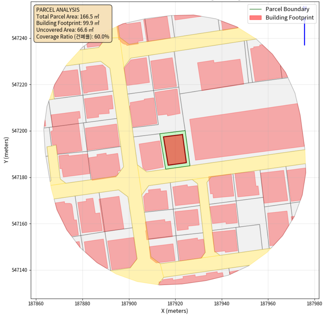
대지 배치도 (원본)