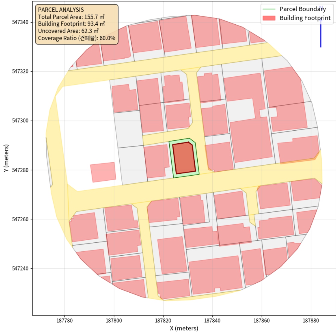
대지 배치도 (원본)