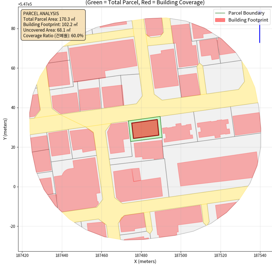
대지 배치도 (원본)