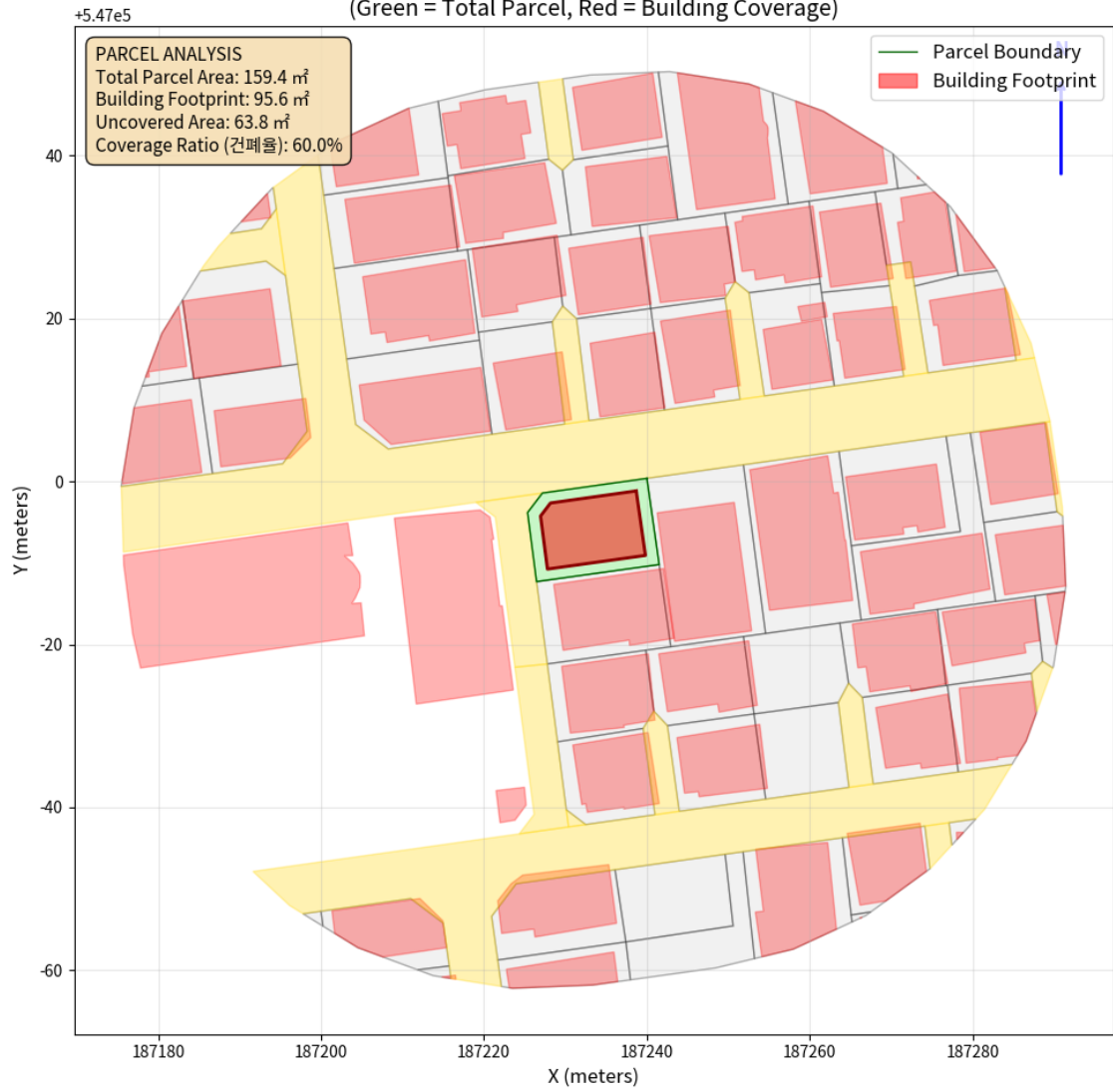
대지 배치도 (원본)