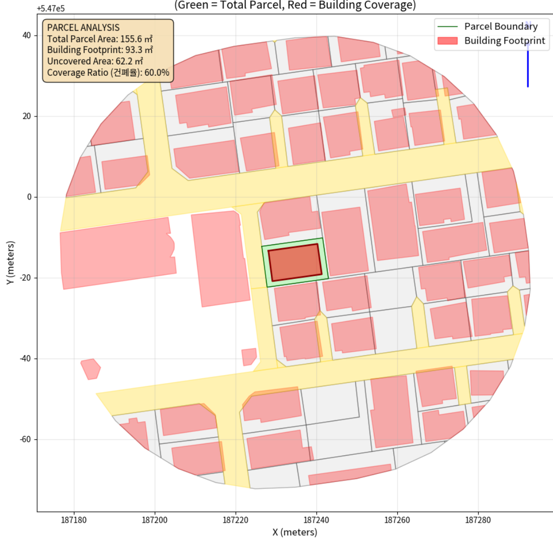
대지 배치도 (원본)