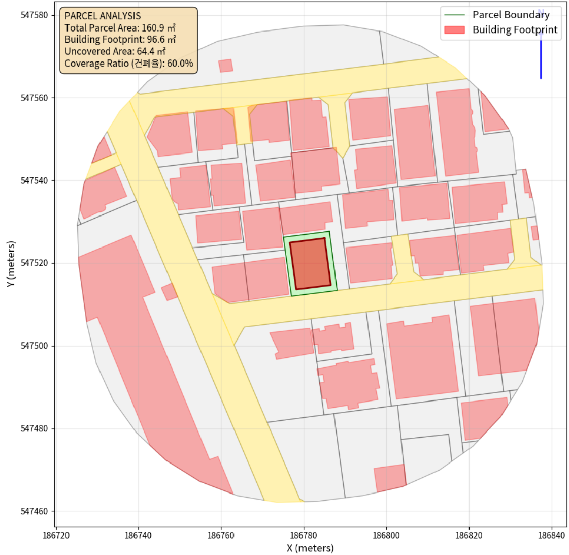
대지 배치도 (원본)