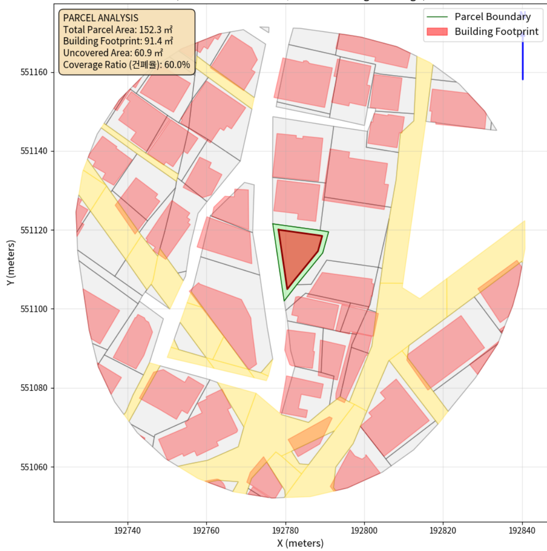
대지 배치도 (원본)