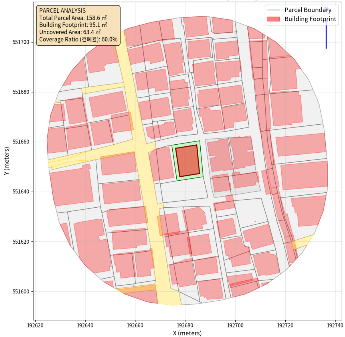
대지 배치도 (원본)