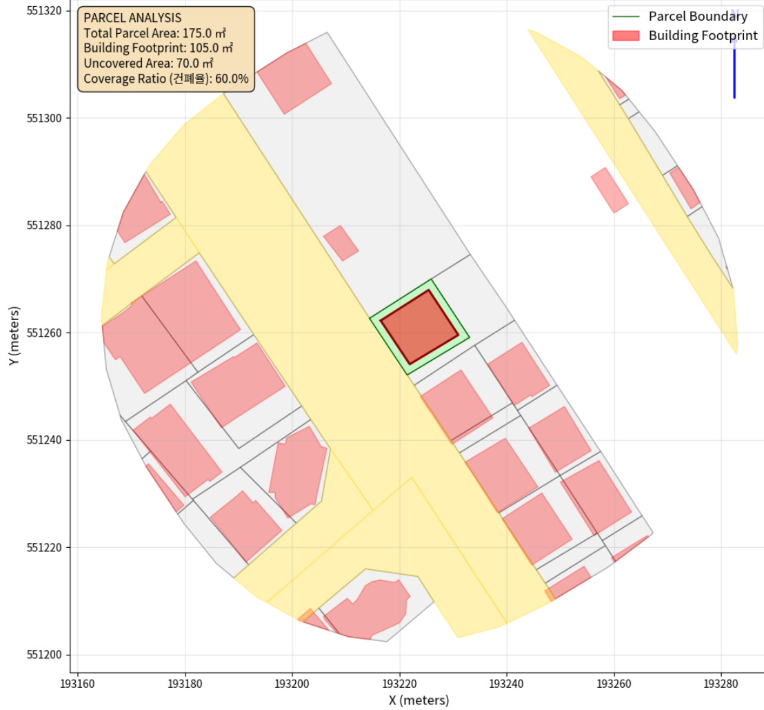
대지 배치도 (원본)