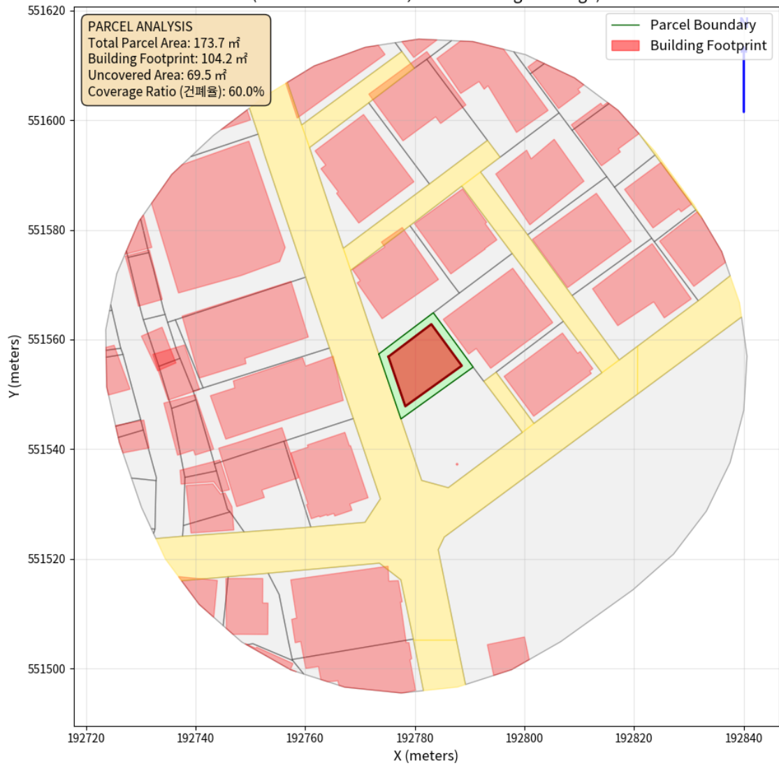
대지 배치도 (원본)