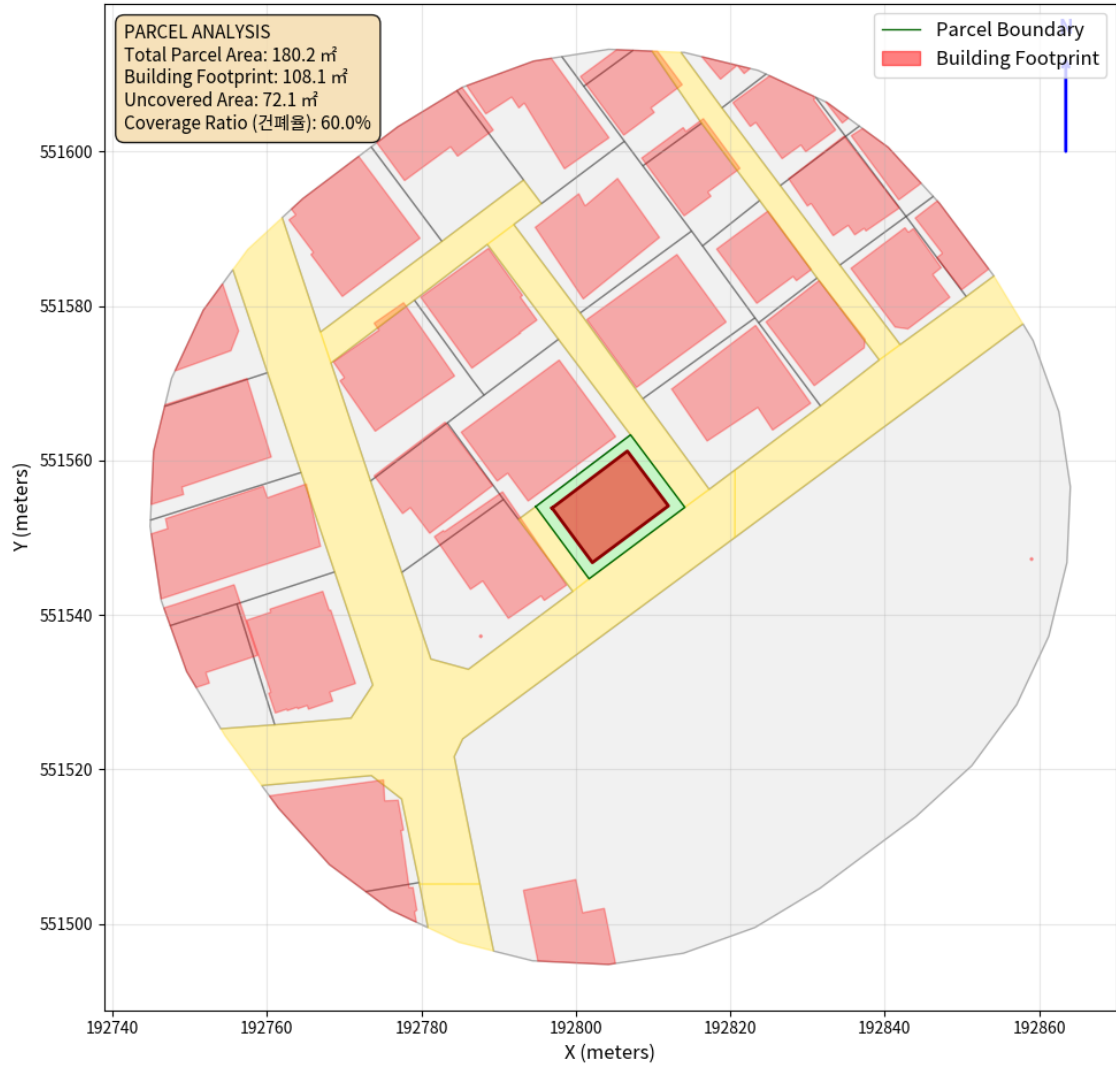
대지 배치도 (원본)