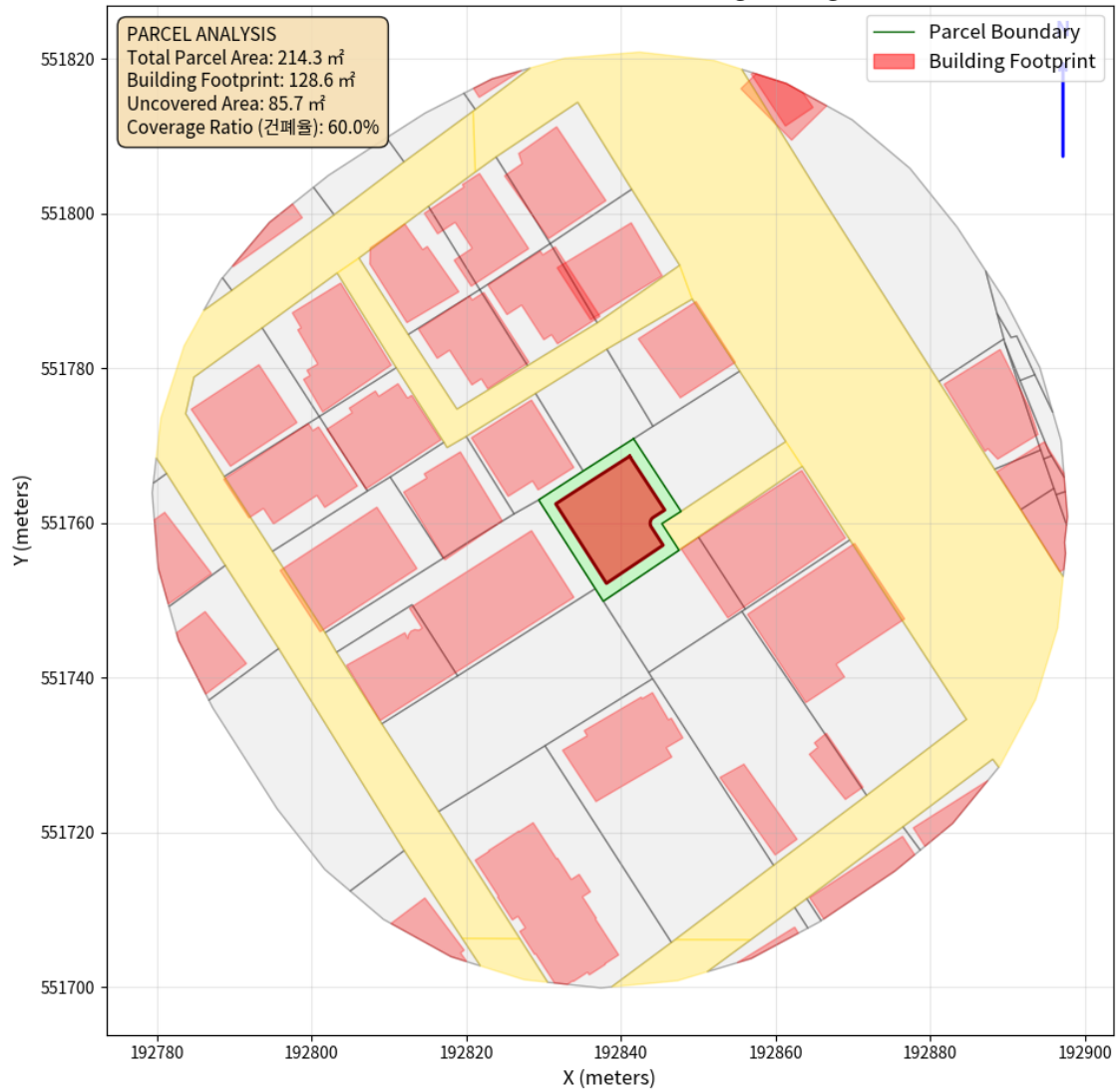
대지 배치도 (원본)