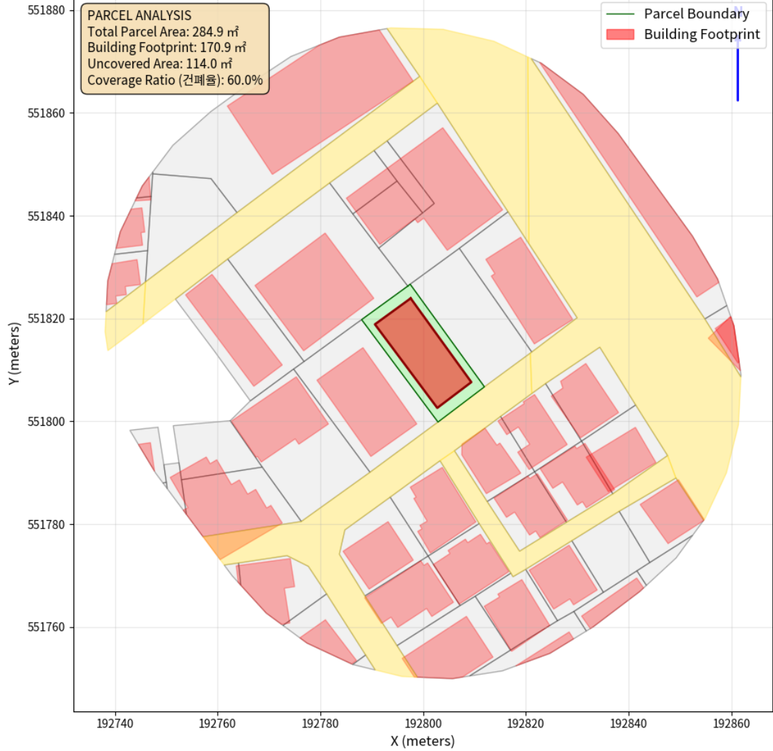
대지 배치도 (원본)