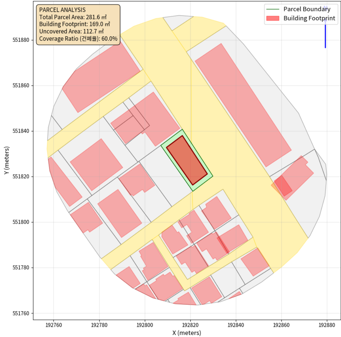
대지 배치도 (원본)