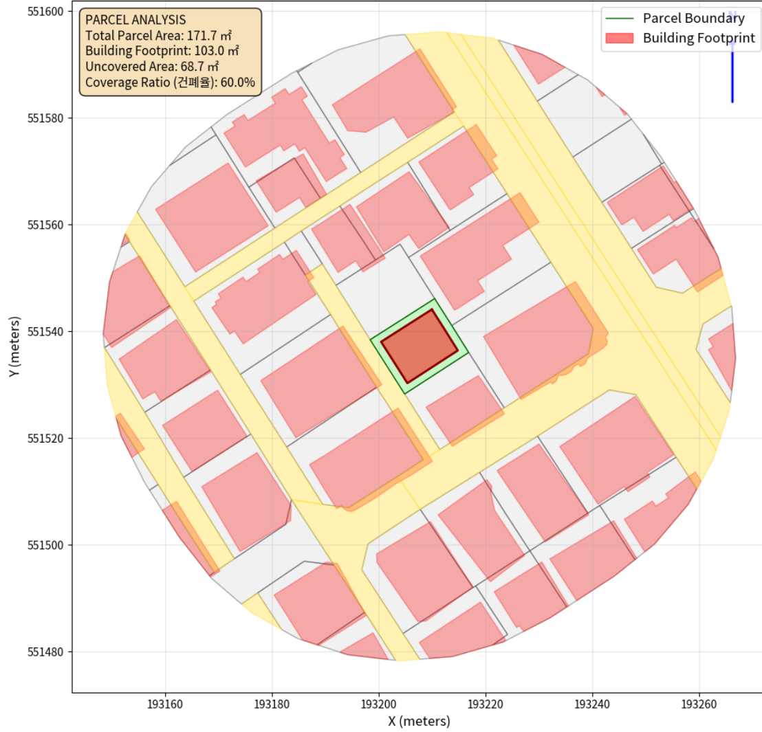
대지 배치도 (원본)