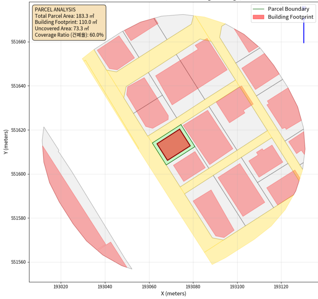
대지 배치도 (원본)