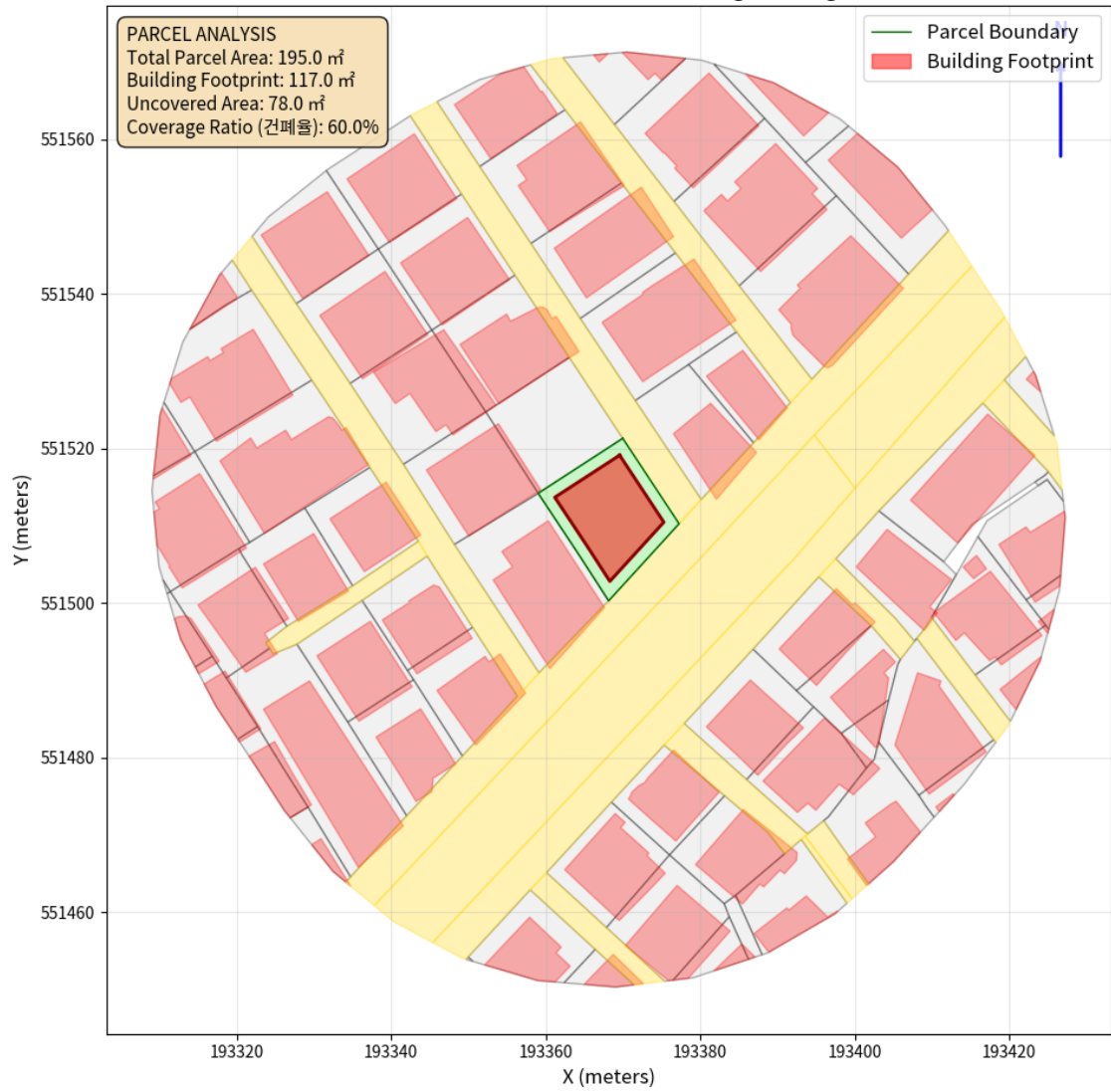
대지 배치도 (원본)