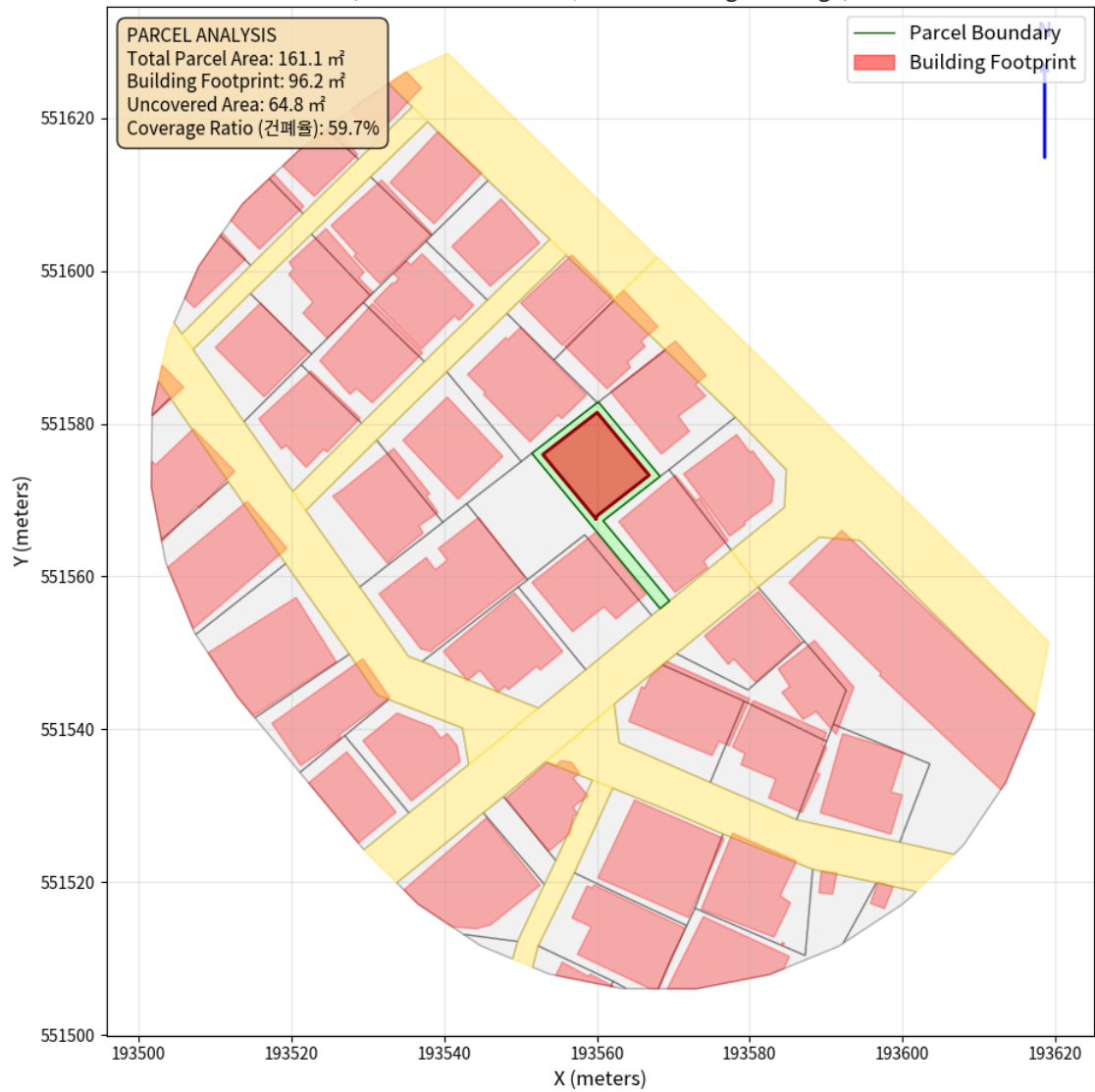
대지 배치도 (원본)