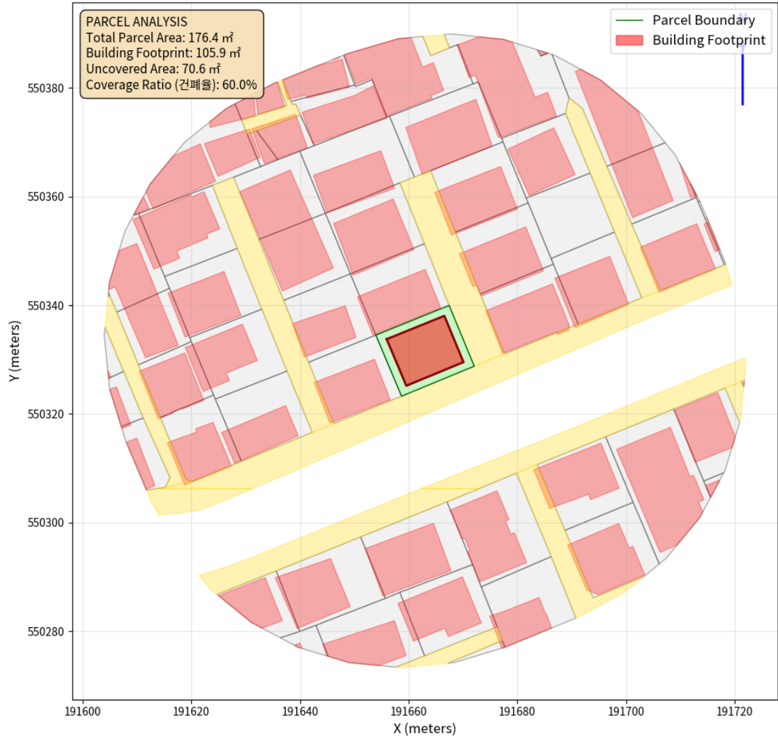
대지 배치도 (원본)